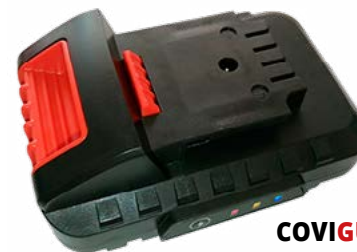
COVIGUN ΜΠΑΤΑΡΙΑ & ΦΟΡΤΙΣΤΗΣ

Εγκρίθηκε από τον ΕΟΦ (ΑΡ.ΠΡΩΤ.: 32566 ΚΝΑ.