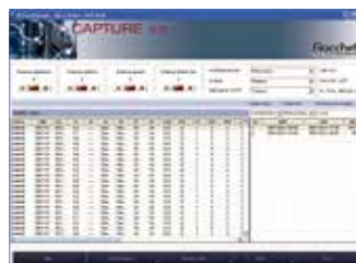
Software Capture 5.0 in dotazione su SD Card. Software Capture 5.0 supplied in the SD Card.