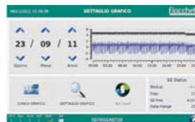
Grafico giornaliero delle temperature con ricerca per data. Temperature daily graph, search by date.