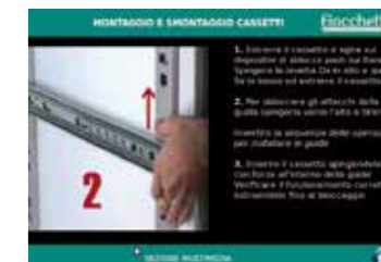
Visualizzazione di video istruzioni per il corretto utilizzo e manutenzione. Video-instructions for use and maintenance.

TUTORIAL multimedia application: integrated interface displaying multimedia files, useful for end users (video instructions, use and maintenance manuals) and for service (electric diagrams, spare parts exploded views).