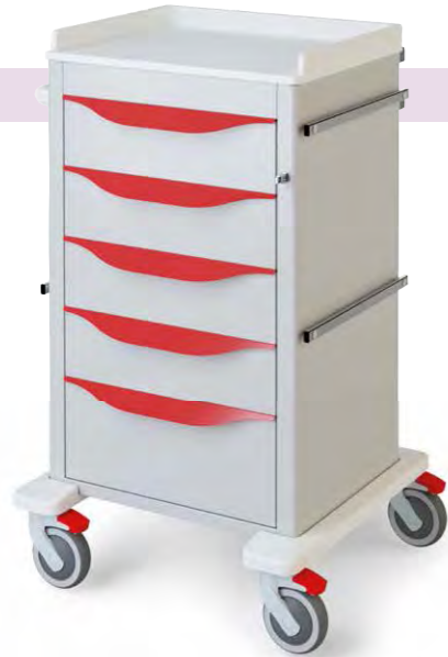
Art. CF301 - EMERGENCY - UTILITY

Configurazioni carrelli - Cart configurations