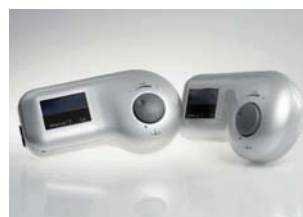
Art.-no. idromed® 5 GS: 100 000 Art.-no. idromed® 5 PS: 110 000