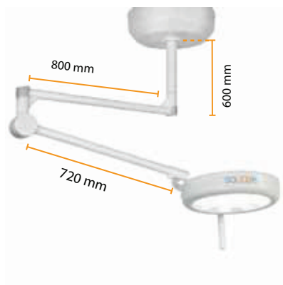
• Οροφής (μονού ή και διπλού βραχίονα)