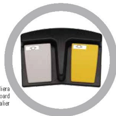
Pedaliera Pedal keyboard Command Pédalier