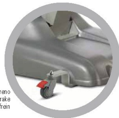
Ruote con freno Wheel with brake Roue avec frein