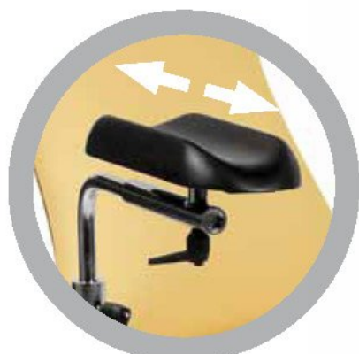
Bracciolo prelievo regolabile Adjustable blood donor armrest Accotoir pour prise de sang réglables