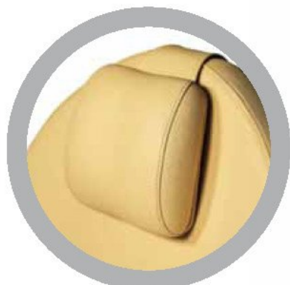
Poggiatesta regolabile Adjustable headrest Tête réglable